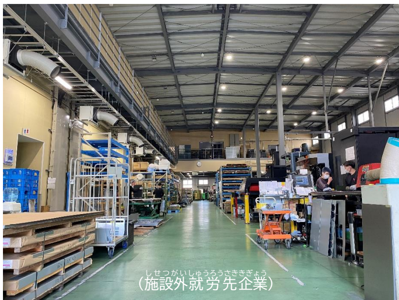
しせつがいしゅうろうさきぎょう (施設外就労先企業)